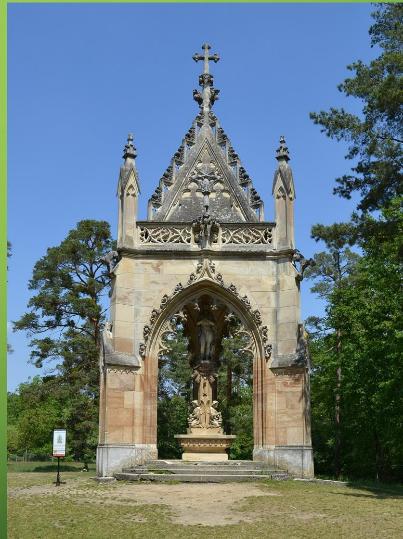
KAPLE SV. HUBERTA