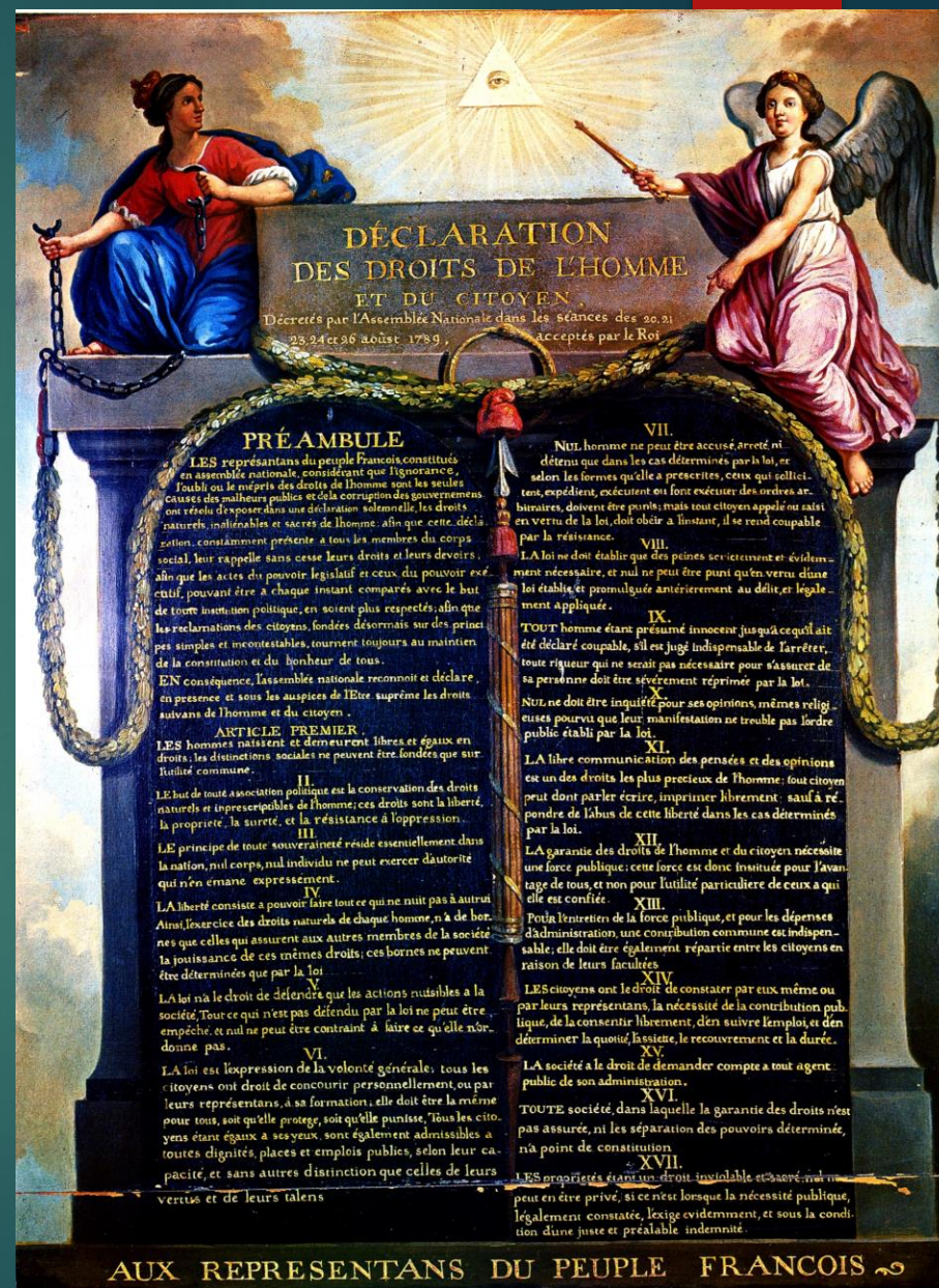
Tato fořka od autora Neznámý autor s licencí CC BY-SA-NC