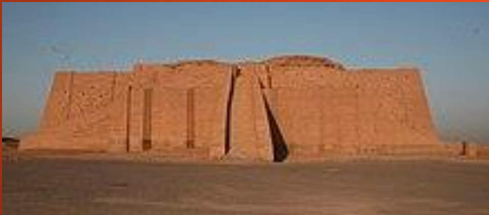
ZIKKURAT V URU