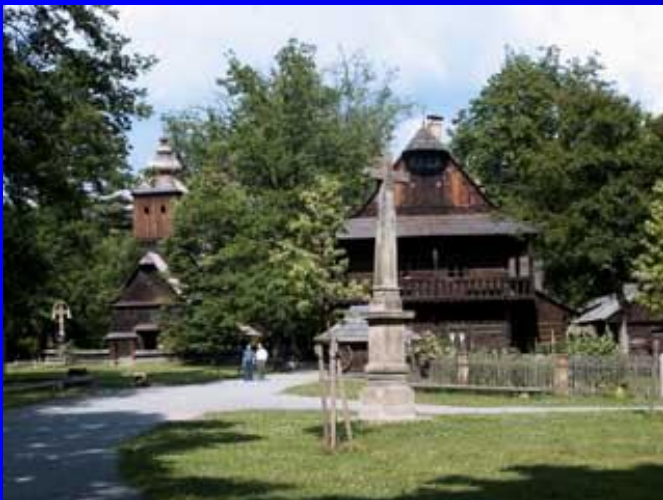
Skanzen v Rožnově p/R.