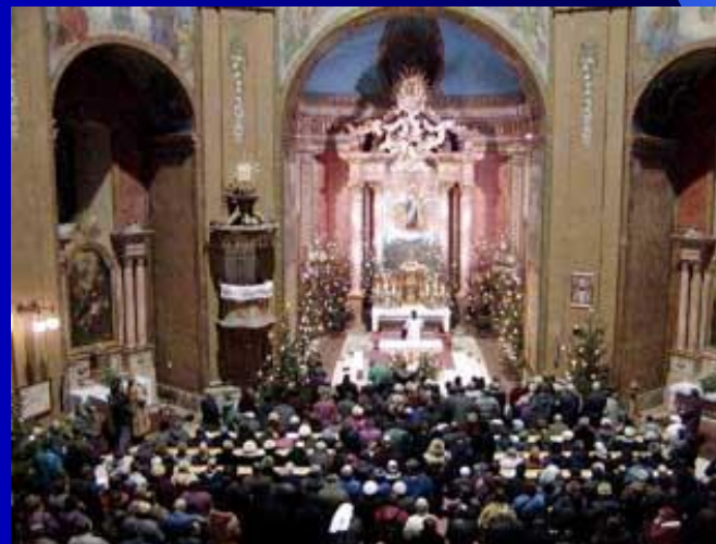
Poutní místo - Hostýn